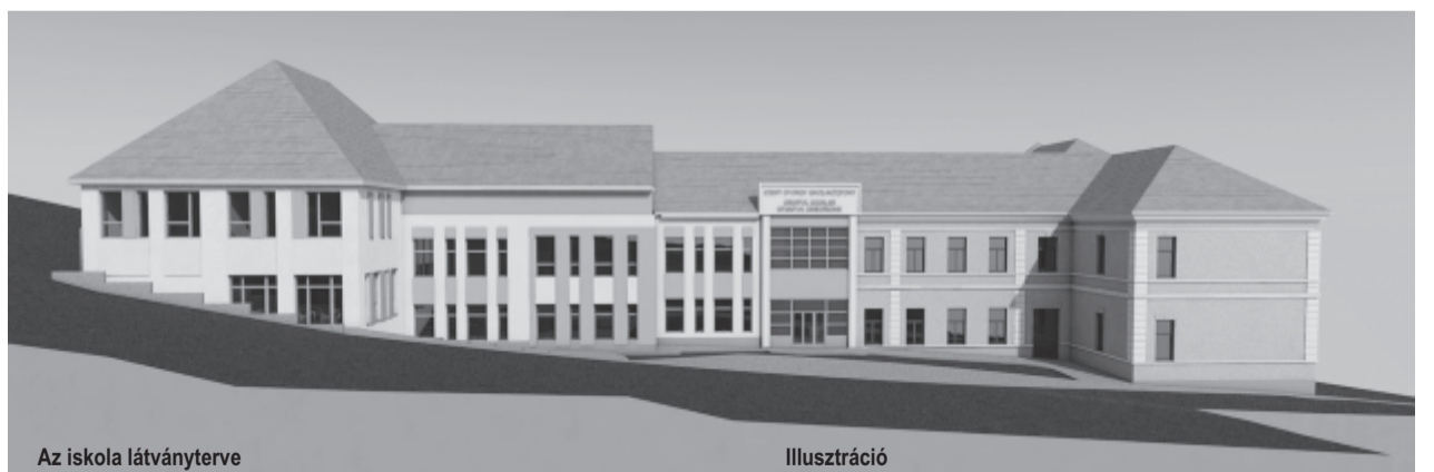
Az iskola látványterve

Az épület korszerűsítése és bővítése mellett a tanintézet udvara is új arculatot kap. A térköveztet terek és járdák mellett gondosan kialakított zöldövezet, sportpályák várják majd a gyerekeket, sőt játszótér is szerepel a tervek között.