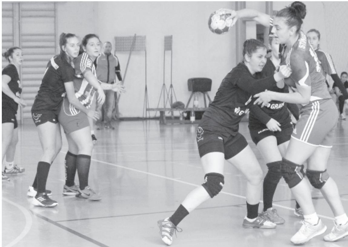
Elszántásból jeles: a képünkön támadó marosvásárhelyiek az utolsó tíz percben ötgólos hátrányból fordították és nyerték meg a meccset.