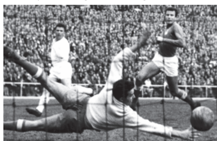
Egy Puskás-gól a sok közül.

A honlap megjegyezte: a Real Madrid és a Barcelona labdarúgójának jó esélye van bekerülni akár a legjobb ötebe is, ehhez a 405 góllal holtversenyben ötödik helyen álló német Gerd Müller és a kameruni Roger Millát kell utolérniük.