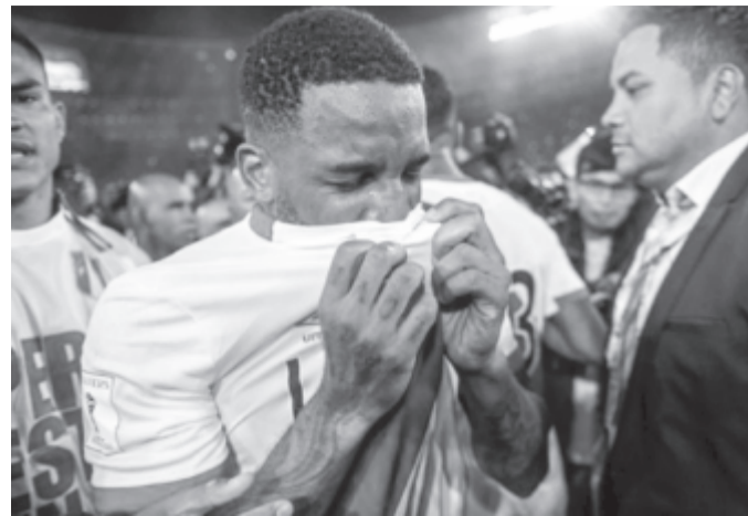
Perui örömkönyvek az interkontinentális pótszelejtező visszavágója után

A dél-amerikai ország kijutásával teljessé vált a 2018-as oroszországi labdarúgó-világbajnokság mezőnye. A Nemzetközi Labdarúgó-szövetség (FIFA) közzétette a 32 csapatot magába foglaló négy kalapot. A sorsolás december 1-jén Moszkvában lesz.