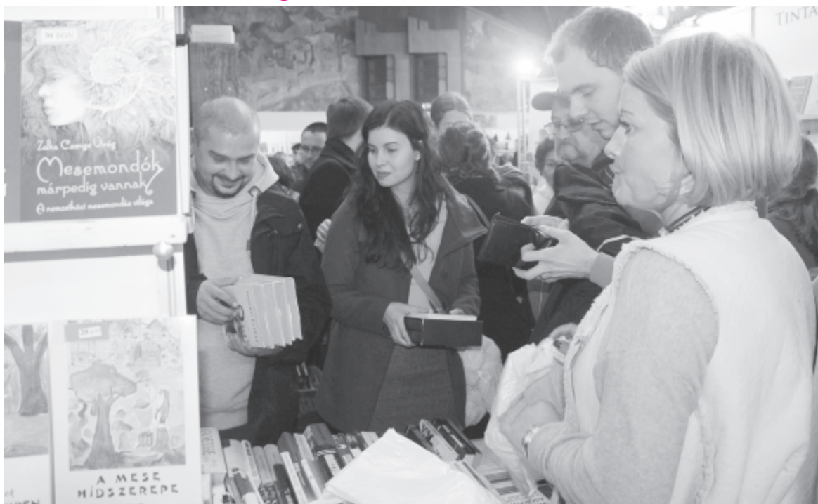
(Folytatás az 1. oldalról)